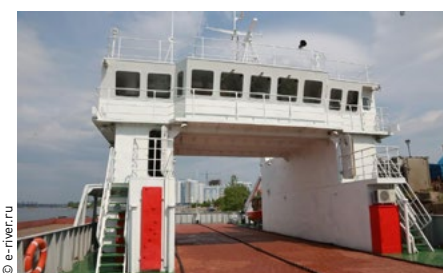
На Красноярской судостроительной верфи построен новый самоходный паром для Игарки.